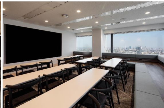
< セミナールーム >