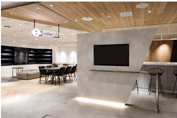
< エントランス >